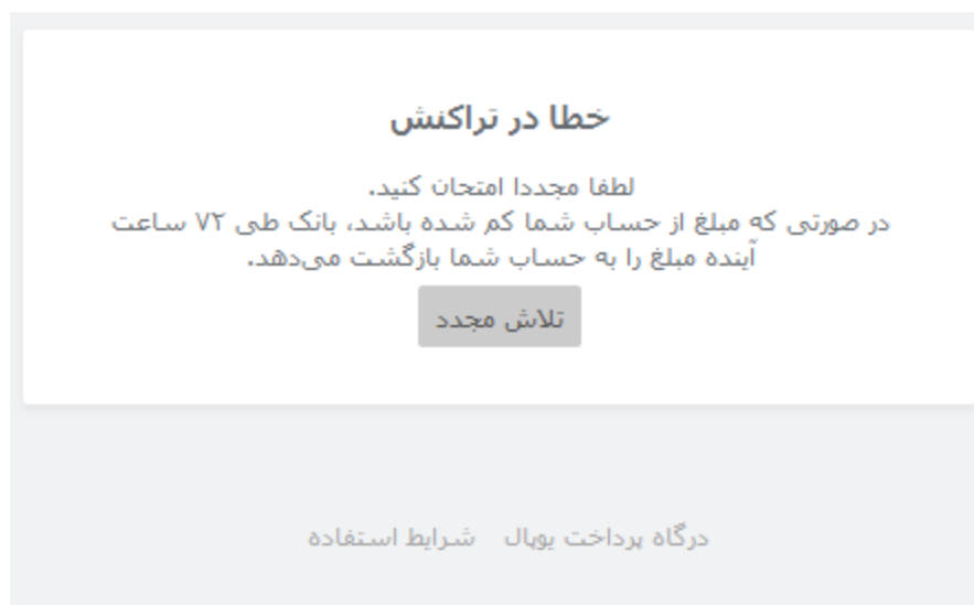
تصویر شماره 7 - خطا در تراکنش

و در صورت انصراف کاربر از پرداخت یا پرداخت ناموفق این صفحه نمایش داده می شود.