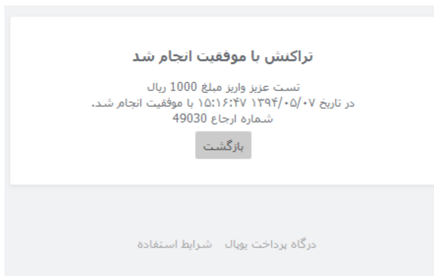
تصویر شماره 6 - تایید پرداخت تراکنش

پس از پرداخت مبلغ در صفحه ی بانک در صورت موفق بود تراکنش و انجام عملیات پرداخت چنین صفحه ای نمایش داده خواهد شد .