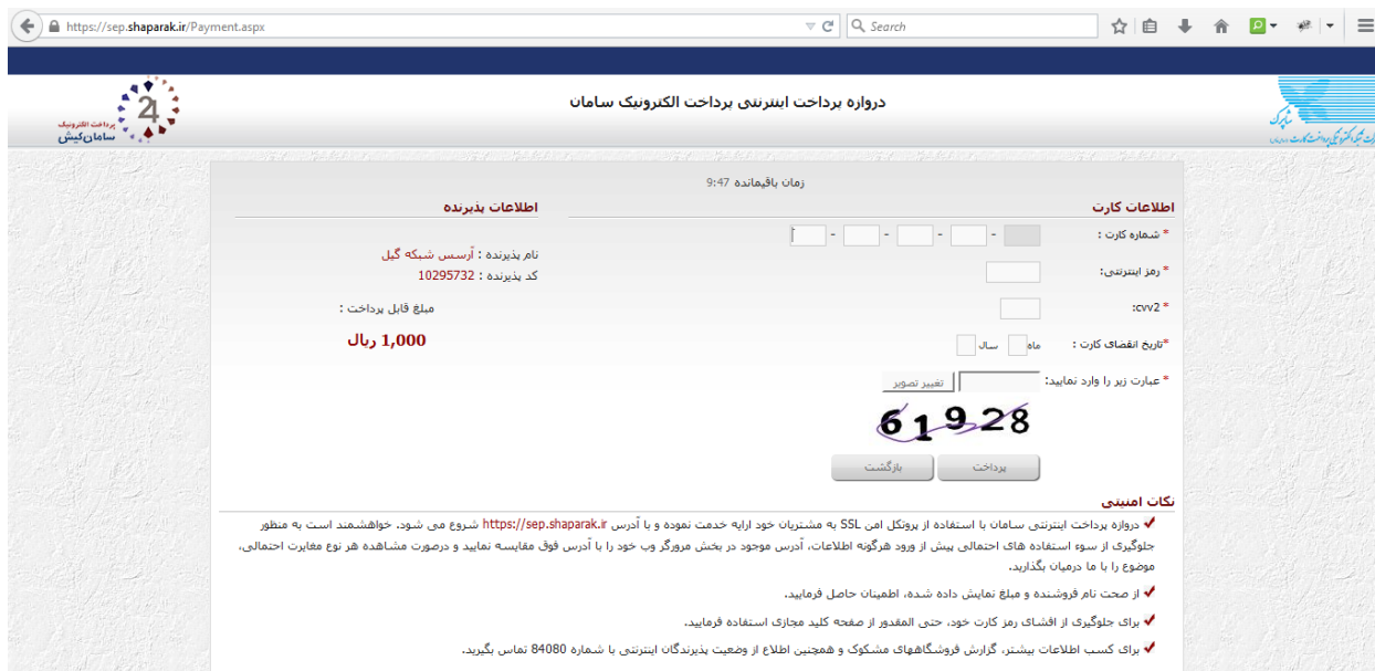
تصویر شماره 5 - صفحه ی بانک جهت انجام عملیات پرداخت

پس از پرداخت مبلغ در صفحه ی بانک در صورت موفق بود تراکنش و انجام عملیات پرداخت چنین صفحه ای نمایش داده خواهد شد .